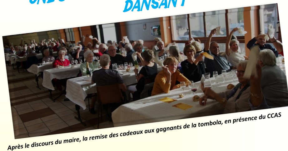
Après le discours du maire, la remise des cadeaux aux gagnants de la tombola, en présence du CCAS

C'est une tradition, chaque 11 novembre, la Municipalité et le CCAS organisent le traditionnel repas dansant pour les plus de 65 ans. 53 convives au rendez-vous.