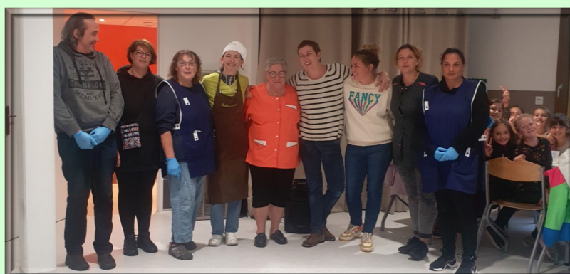
L'équipe de la cantine